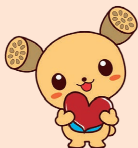
土浦市イメージキャラクター つちまる

入居のお問い合わせ・見学・認知症に関するご相談など随時承っております。 お気軽にご連絡ください。